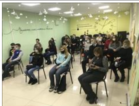
Часть общего вида Участники площадки Форума

Мероприятие: Дискуссионная площадка «Развитие системной благотворительности» в рамках регионального Форума «Роль социально ориентированных некоммерческих организаций в устойчивом развитии Смоленской области»