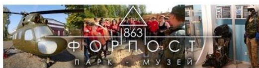
ПАРК-МУЗЕЙ «ФОРПОСТ 863»

Интересный пример такого «частно-некоммерческого консорциума» в Смоленске – это «Парк музей ФОРПОСТ 863» 1 , расположившийся на частной территории, примыкающей к бывшему аэродрому «Южный». Парк-музей «Форпост 863» - первый в регионе милитари-парк, на территории которого уже работают: полигон военно-тактических игр, музей авиации, интерактивные образовательные классы, мастерская стендового моделизма и полигон радиоуправляемых моделей.